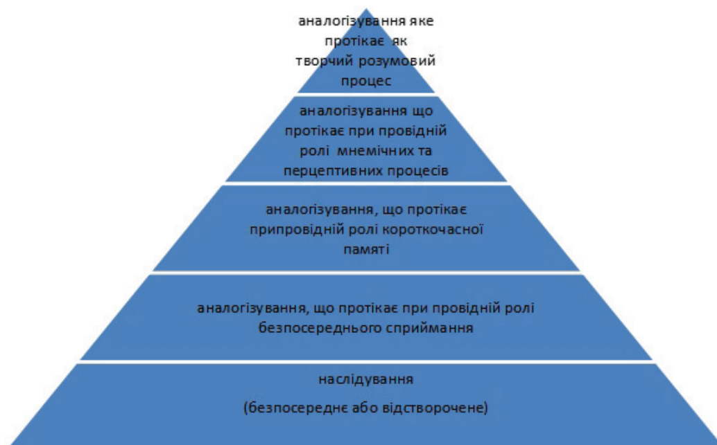
Рис. 1. Функціонування творчого аналогізування на різних рівнях

смысл зображеного. Стимульні фігури були запозичені із дослідження О.В. Губенка (див. рис. 2).